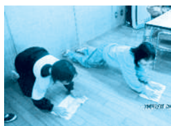
▲ 関上児童センター