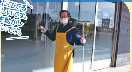
名取市ボランティア連絡会の活動費の一部にも共同募金が使われています