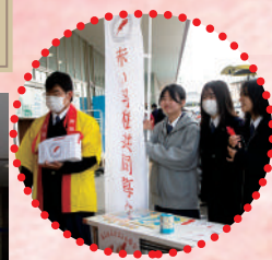
R7.11.8 フレスコキック名取増田店にて、元気に呼びかける部員のみなさん