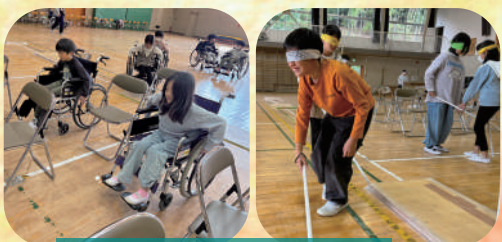
福祉体験事業の開催