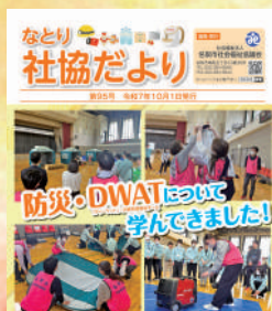
なとり社協だよりの発行 毎年2回（10月1日、3月1日）発行