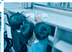
▲ 増田西児童センター