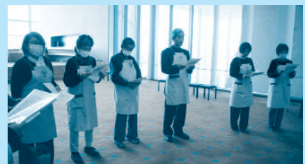
▲名取市社会福祉大会でのボランティア活動の様子