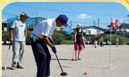
名取市老人クラブ連合会スポーツ大会 熱中症対策に清涼飲料を提供