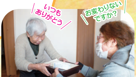
一人暮らし高齢者へ お弁当のお届けサービス 高齢者が負担するお弁当費用の一部やお弁当を作ってくれる業者、届けてくれるボランティアの活動費になっています。

宮城県内で活動する様々な団体や福祉施設の設備・車両の助成、災害時のボランティア支援等、県内での活動の助成事業に使われます。