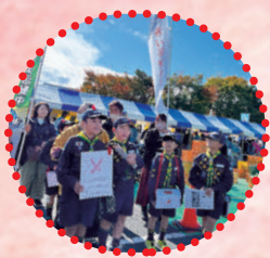
R7.11.3 ふるさと名取秋まつりで、お手製のポスターを掲げ、募金活動する隊員のみなさん