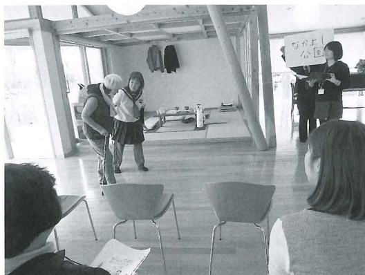
▲寸劇を交えてさらに認知症への理解を深めます。