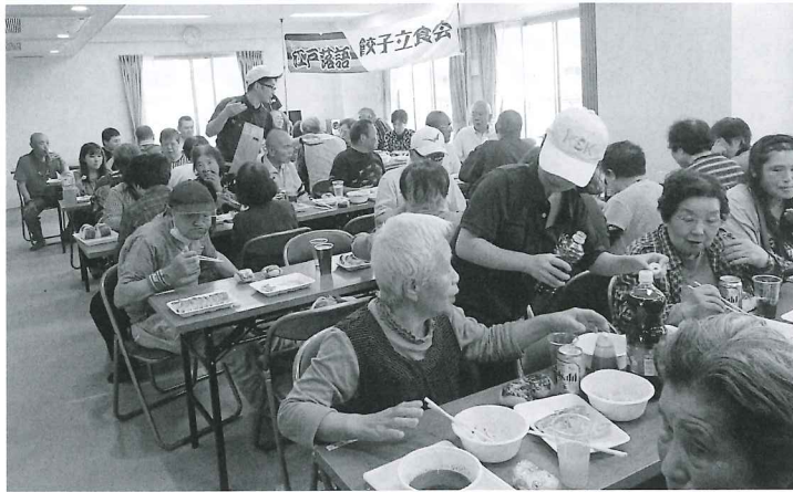
▲会場は大勢の方で超満員！社員の皆さんとの交流も楽しみました！

おいしい物を一緒に食べると自然に笑顔になり、会話も弾みます。こうした交流が隣近所とのつながりを生むきっかけになっていくものと期待されます。ご協力いただいた皆さん、ありがとうございました。