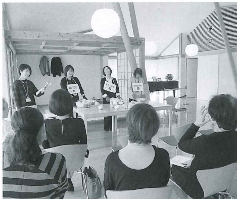
▲ほっとなとりスタッフがキャラバンメイトとして講義を担当。手作りの教材を使ってわかりやすく説明します。

社協だより第80号（平成30年3月1日発行）で募集しました「認知症サポーター養成講座」は、平成30年3月15日、名取市文化会館 希望の家にて開催しました。当日は30代から70代までの幅広い年代から参加をいただき、認知症の人やその家族を支え守る応援者としての知識を深めました。