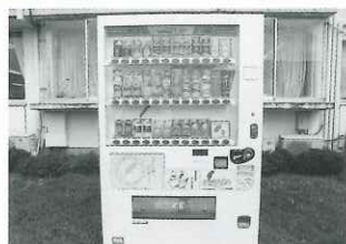
【名取市友愛作業所】