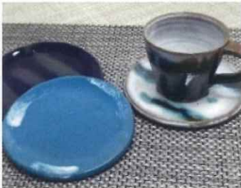
和食器・ティーカップ