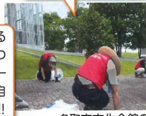
名取市文化会館の