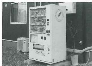
【名取市社会福祉協議会】