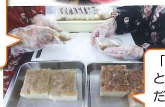
お菓子作りの作業様子の写真です▶