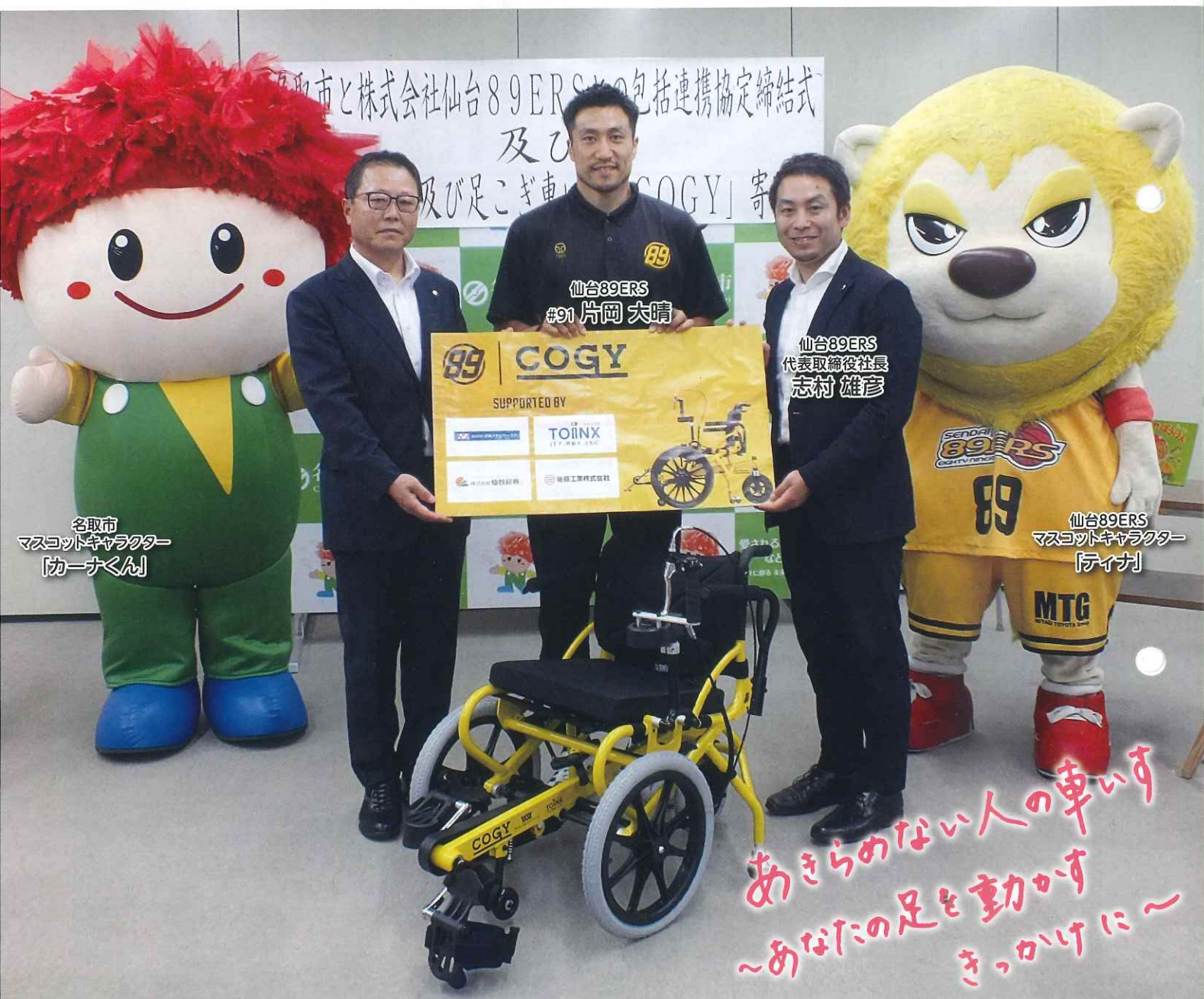
名取市 マスコットキャラクター 「カーナくん」