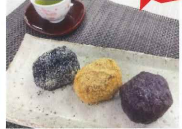
おはぎ (名取産もち米100%)