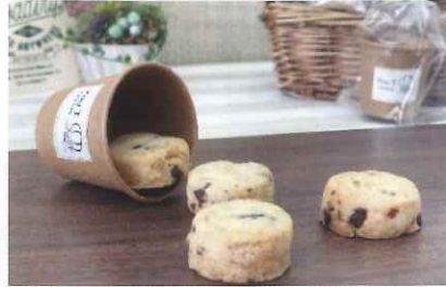
クッキー (バニラ・ココア・チョコとくるみ)