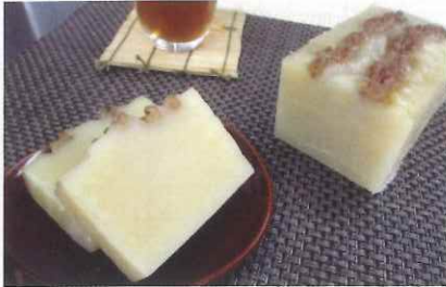
がんづき (ごま・みたらし・くるみ)