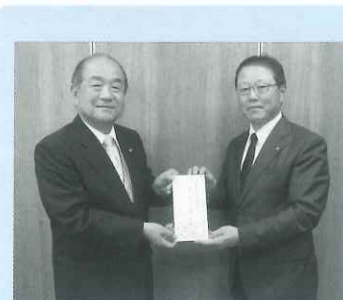
▲恵庭ロータリークラブ・名取ロータリークラブ様より寄付金贈呈の様子

※その他、匿名希望の方から寄付金 (10件・138,599円) をいただきました。