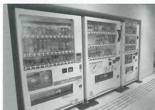
【名取市文化会館様】