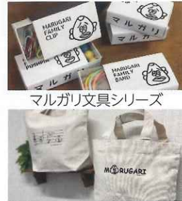
マルガリ文具シリーズ