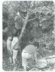
たくさんさんの梅の実の収穫の様 子に興味津々