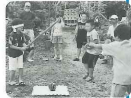
夏の風物詩 スイカ割 「こっち」「もっど前」 うまく当たるかな～