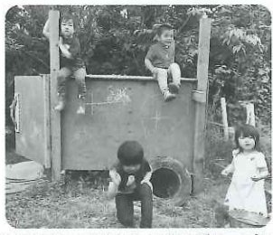
自然の中には好奇心と発見がいっぱい