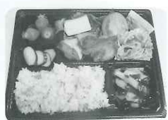
テイクアウト用のお弁当