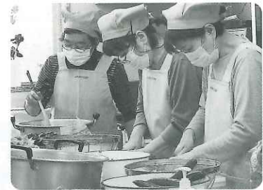
旬の野菜を取り入れた栄養豊富な食事を提供しています