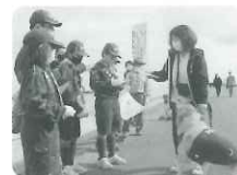
地域の方も ご散歩中にご協力