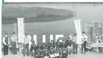
ボーイスカウト名取第1団カブ隊の皆様

11月14日(日)かわまちてらす閑上にてボーイスカウト名取第1団カブ隊による街頭募金を実施しました。当日は曇一つない秋晴れ!子どもたちの元気な掛け声と笑顔で、買い物や散歩に訪れた皆様よりご協力を頂き、ありがとうございました。