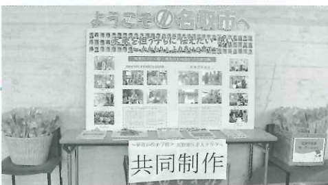
▲カーネーションとウェルカムボードで歓迎