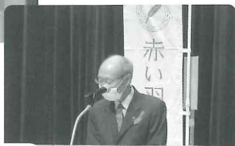
共同募金奉仕委員より挨拶