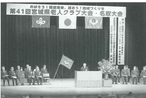
▲宮城県老人クラブ連合会会長のご挨拶

第2部では、宮城県老人クラブ連合会の表彰式が行われ、28名、26団体が受賞、うち名取市老人クラブ連合会では1名と1団体が受賞されました。おめでとう