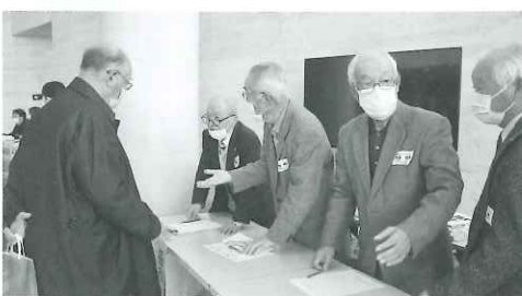
▲老人クラブの会員による受付

でございます。名取市老人クラブ連合会では、来訪してくださる皆様のために、さまざまな「おもてなし」を行いました。市内の魅力ある施設等の観光パンフレットや美味しい食べ物で紹介されたパンフレット、サッポロビール様協賛品のほか、会場内を240本のカーネーションで華やかに装飾し、カーナくんがお出迎えしました。また、那智が丘小学校製作のウェルカムボードや復興の感謝を込めたあたりがとうボードを作成し展示しました。更に、ひとつひとつ心を込めて手作りした小物にメッセージカードを添えてお渡しし、お帰りの際にはカーネーションをお渡ししながらお見送りしました。 コロナ禍でも、名取市老人クラブ連合会と名取市ボランティア連絡会、名取市社会福祉協議会、その他多くの方々の心を込めた「おもてなし」で無事、閉会することができました。