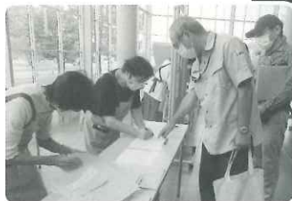
名取市ボランティア連絡会の 協力による、各町内への 運動資材を配布