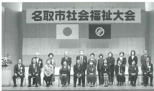
▲当日社会福祉大会にご出席いただいた受賞者の皆様との記念写真(密を避けるため2回に分けて撮影しました)