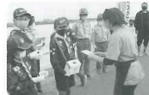
お店の方も ご協力