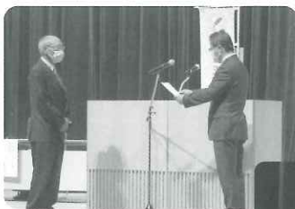
名取市共同募金委員会 会長より委嘱状の交付

また、奉仕委員の代表者より自分のまちを良くする赤い羽根共同募金運動への意気込みをお話し頂き、10月からのスタートに気持ちをひとつにしました。