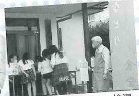
▲受付を外に設置して、検温・消毒もちゃんとしています。