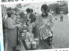
▲自分で種類を選べるバイキング方式です。

この度は助成をいただきありがとうございました。 アメニモマケズ、カゼニモマケズ、そしてコロナ禍にも負けず！ ボランティア、各企業の協力も得ることが出来て、試行錯誤しながら運営を 継続しています。