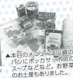
▲本日のメニューは山崎のパンにポッカサッポロのスープなどなど。お野菜のお土産もありました。