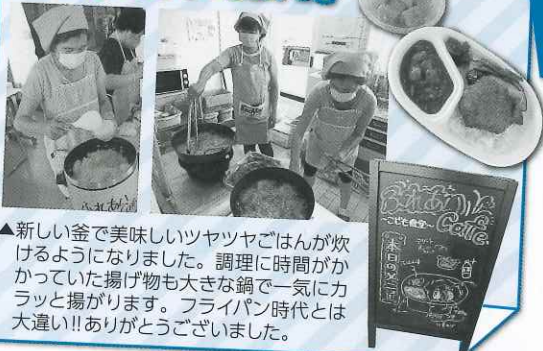
▲新しい釜で美味しいツツツごはんが炊けるようになりました。調理に時間がかかっていた揚げ物も大きな鍋で一気にカラッと揚げられます。フライパン時代とは大違い!! ありがとうございました。