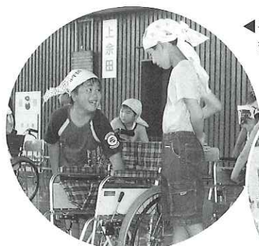
◀子どもたちを対象とした福祉教育の費用として