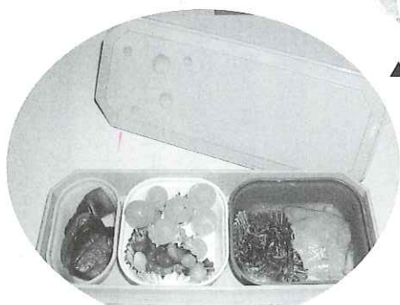
◀ひとり暮らし高齢者へのお弁当配達など地域住民の生活支援を行う事業費として

10月1日から全国一斉に展開される「赤い羽根共同募金運動」今年もその季節がやってきました。 現在、中央共同募金会ではみんなまで出して、みんなを集めて、みんなで使おうという地域循環の発想のもと、全国的に共同募金のあり方について改革を進めております。 「募金をする事で、結果的に地域活動に参加する」そんなつながりを生む共同募金運動になるべく、励んでまいりますので、皆様のご理解とご協力をお願い申し上げます。