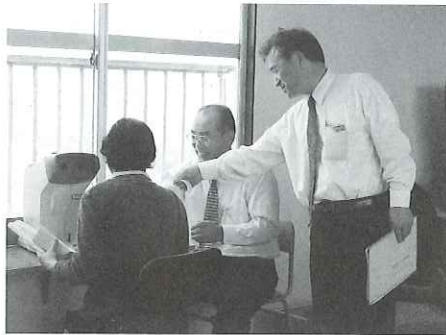
▲視力検査後は、一人一人の結果に応じた、運転時の注意点などを教えていただきました。