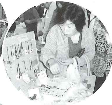
▲住民の地域づくりや、研修会、交流の為のイベントなどの開催費用として。