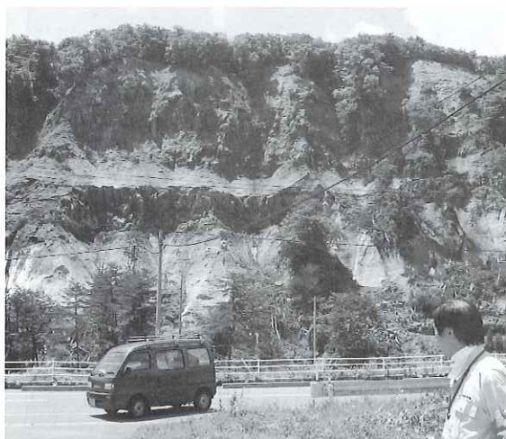
▲栗原市花山地区の様子。山の斜面全体が地震で崩れ落ちていました。

震災からまもなく4カ月、被災した方々が少しでも早く、以前の生活を取り戻せるよう、今後も社会福祉協議会として協力してまいります。