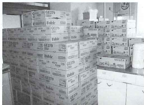
▲被災地社協には多くの物資が寄せられています。