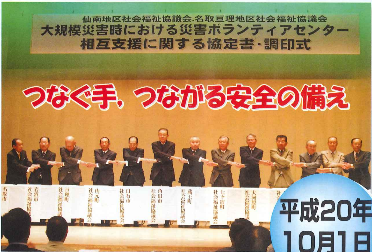
災害ボランティアセンター相互支援に関する協定書・調印式の様子 (詳しくは2～3頁)