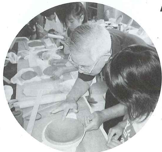
▲お手元に届いた陶芸は上手くて驚いてしまった。皆さんも真剣に体験していました。