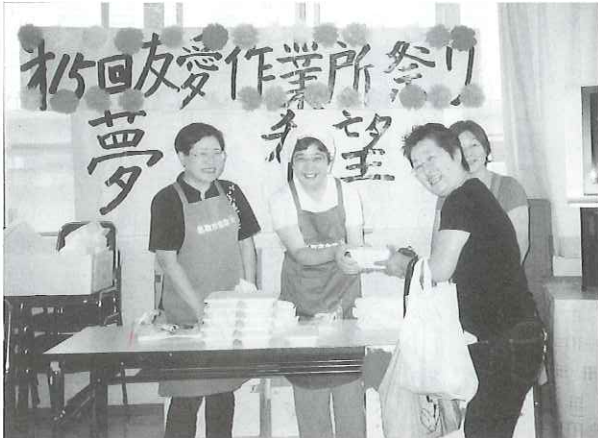
▲「赤飯200円まいどあり〜」。多くの模擬店でも賑わいをみせ、完売しました。

今年は「名取ロータリークラブ」からの出品寄付のもと、オークションを行うことができ、持ちきれないほどの商品を手に帰られたお客様もいたようです。