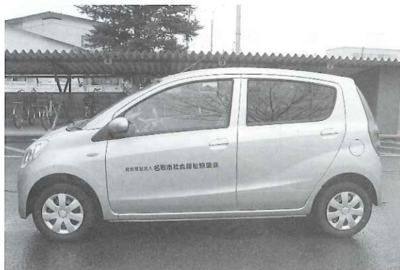
▲社協の車としては、珍しいピンク色。配食サービスのボランティアさんにも大好評です。