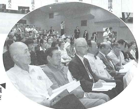
▲名取市社会福祉協議会からも理事の皆さんが参加しました。