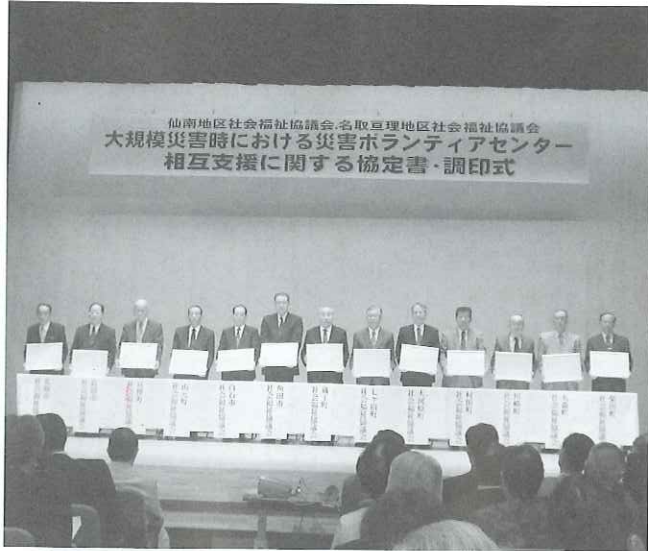
▲4市9町の社会福祉協議会会長がステージ上で協定書にサインを行いました。

その中でも中心となる活動は、全国から被災地支援に集まってくるボランティアの派遣調整であり、これは日頃からボランティアと関わりが深い社会福祉協議会だからこそ、担う事が出来る役割なのです。