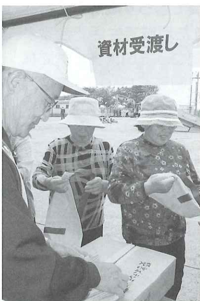
▲実際の災害現場同様、資材受渡し等の様子も訓練しました。

参加いただいたボランティアの皆さんにとっては災害VCを知っていただく機会に、職員にとっては災害VCの機能を再確認する機会になりました。