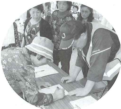
▶ボランティアも職員も真剣に訓練を行いました。