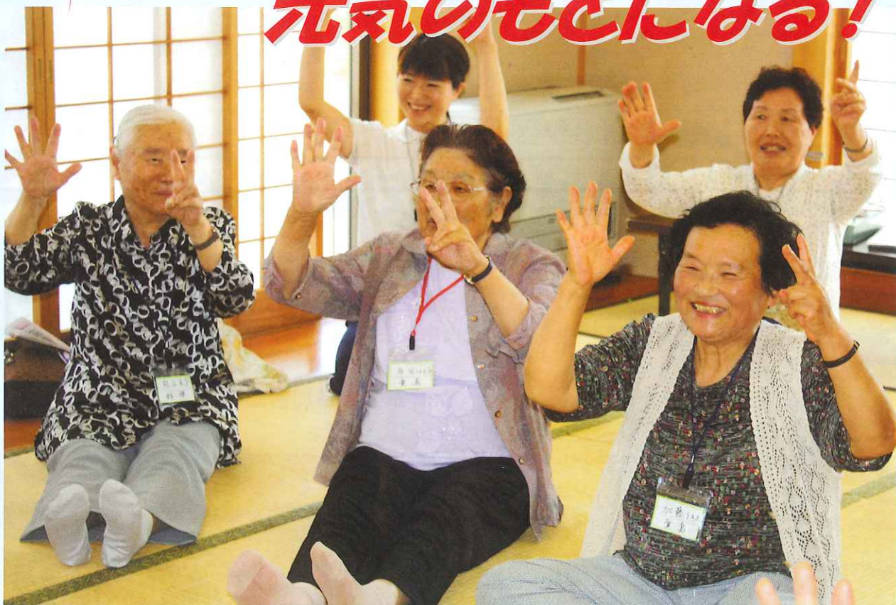
名取南地域包括支援センター 介護予防教室の様子 (詳しくは2~3頁)