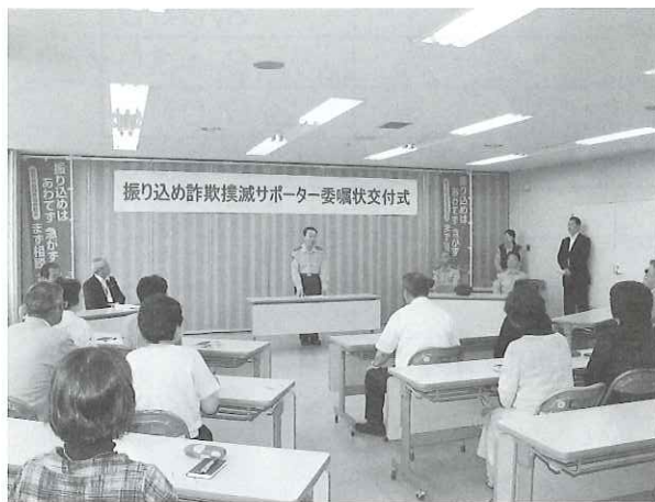
▲7月22日、委嘱状の交付式が執り行われました。

交付されたのは、名取市内の民生委員及び主任児童委員120名で、今後、日頃の支援活動の中で、「振り込め詐欺」に関する注意を呼び掛けていくこととなります。