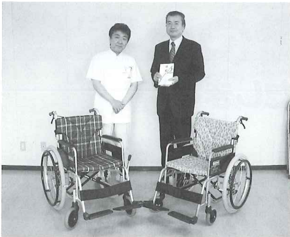
▲医療法人社団洞口会グラウンドゴルフ会から車イスをご寄付いただきました。