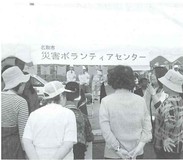
▲災害VCの紹介も行うことができました。

名取市社会福祉協議会でも、日頃から災害VC運営の為に準備を行っています。ここでは平成21年度に実施した2つの取り組みについてご紹介します。