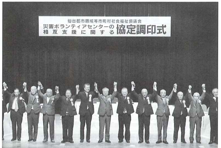
▲協定書へのサインの後、15市町村社協の会長が今後の連携の気持ち込めしっかりと手をつなぎ合わせました。