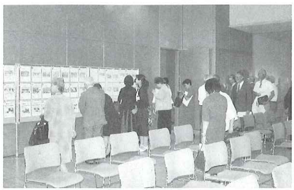
▲式典では、昭和47年に発行された第1号から現在までの社協だよりの展示を行いました。