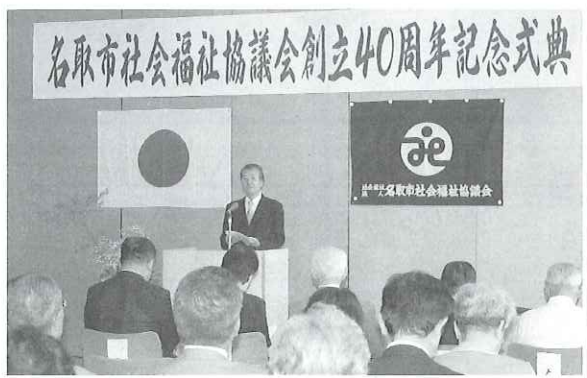
▲関係団体の皆様にご出席いただき 40周年記念の式典を行いました。

40年前と比べると介護保険制度や障害者自立支援法など、福祉に関する状況が変化していますが、名取市社協が地域住民の皆さんと寄り添える存在であるべく、一歩一歩歩んでまいります。今後とも、ご支援、ご協力をお願いいたします。