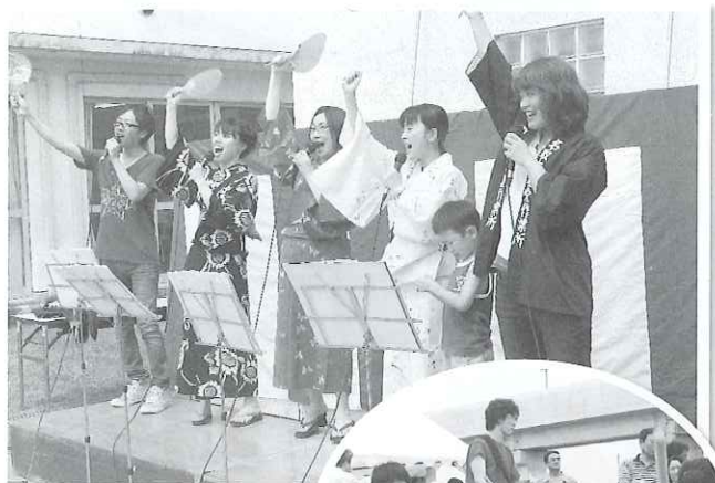
▲第17回友愛作業所まつりの様子。過去最多の来場者数で大盛況でした。

そんな、地域の皆さんとの「つながり」を友愛作業所の活動風景を納めた写真で、ご紹介します。