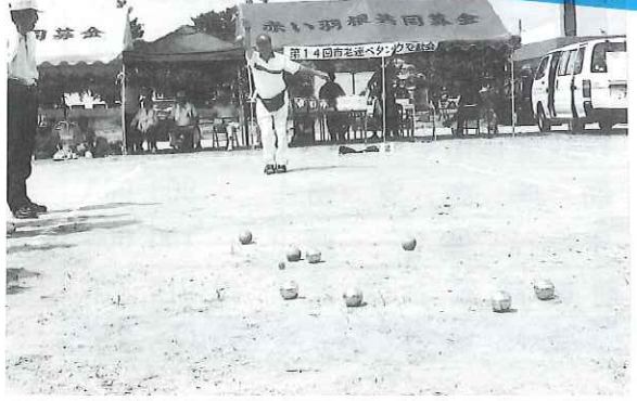
◀団体競技のペタンクはチーム対抗戦で行う為、熱い戦いが繰りひろげられました。