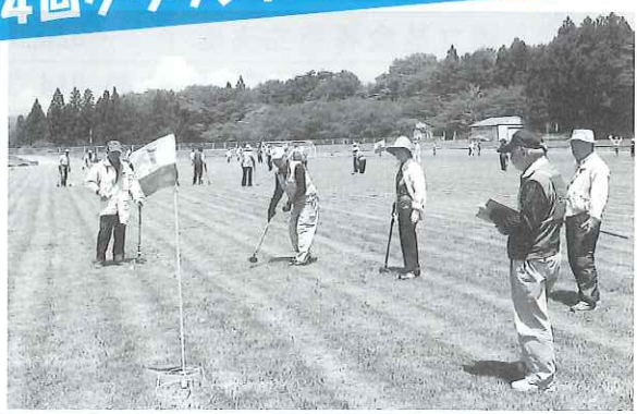
▶6月2日十三塚陸上競技場で開催しました。