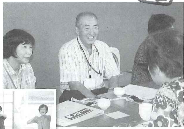
▲第1回目にもかかわらず、皆さん話の花が咲き、あっという間に時間が過ぎてしまいました。

名取市社協では、名取市からの受託を受け、認知症高齢者等を支える家族のつらい『いっぷく堂』を始めました。