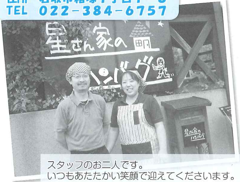
スタッフのお二人です。 いつもあたたかい笑顔で迎えてくださいます。

地域との「つながり」のもう一つの形として、協力店における「自主製品販売」があります。これは友愛作業所のメンバーが作業訓練の一環として作成した菓子を各協力店で販売頂く事ですが、この販売により店舗と作業所の関わりが生じ、各店舗を訪れた皆さんにも友愛作業所を知っていただく事ができます。このような販売を通して、友愛作業所は地域の輪の中に自然と溶け込んでいきます。 現在、こうした「つながり」を生む為に名取市内外8か所で友愛作業所の菓子を販売して頂いています。そんな中から今回は1店舗をスタッフの方々へのインタビューと共にご紹介いたします。