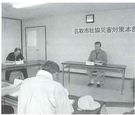
▲名取市社協災害対策本部設置訓練の様子。

当日は増田地区のボランティアの皆さんにもご協力いただき、災害VCの機能などを市民の皆さんに知っていただく機会にもなりました。