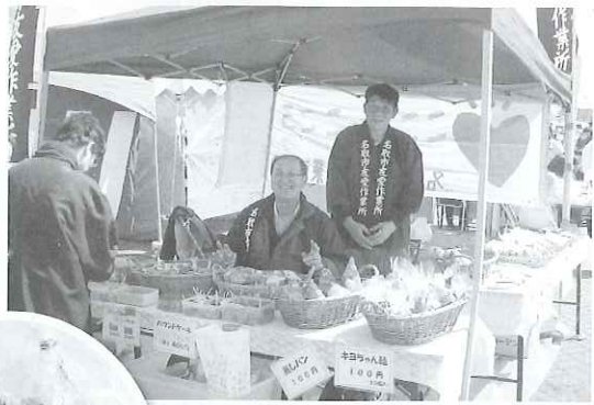
▶おまつり等のイベント時にはメンバー・職員揃って自主製品の販売に出かけます。