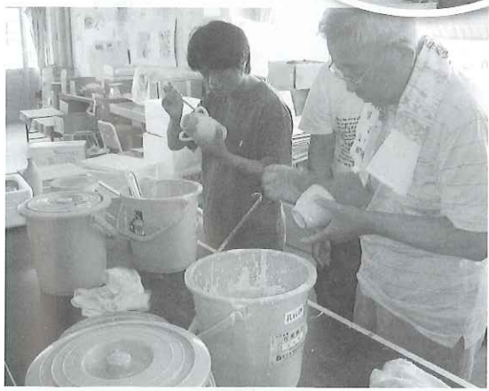
▲陶芸教室での一枚。焼き上げた味のある品物は販売も行います。