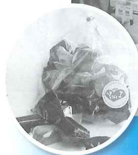
◀自主製品にはキヨちゃん飴やクッキーなどのお菓子の他、はがきや玄米ダンベル等もあります。