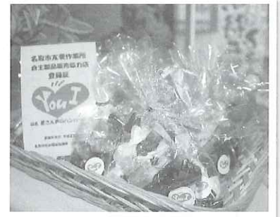
▲販売協力店の登録証を添えて、友愛作業所のお菓子を置いて下さっていました。