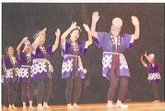
★老人クラブ関係行事（芸能大会、グラウンドゴルフ交歓会、ペタンク交歓会）