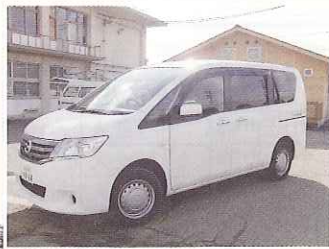
▲公益財団法人オ リックス財団様か らも車輛2台をい ただきました。