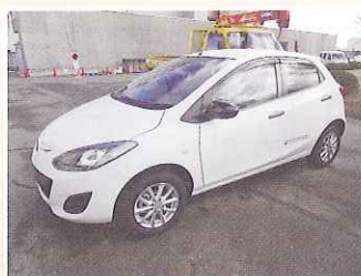
▲ゴールドマン サックス証券様 からは車輛の寄 付をいただきました。