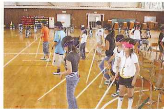
★障がい疑似体験（キャップハンディ体験）