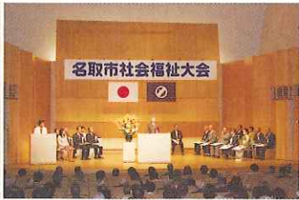
★社会福祉大会開催