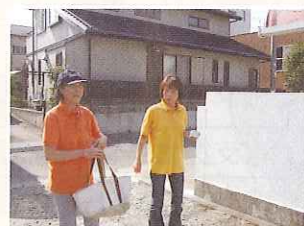
★配食サービス（ひとり暮らし高齢者等への弁当配達）