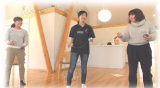
東北福祉大の実習生さん2名も参加してくれました