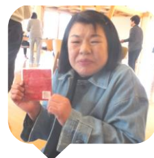
参加スタッフが10個たまりコースターのプレゼントです