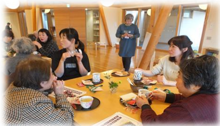
最後にゆったりカフエタイム～