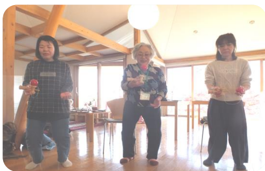
お上手！ パチパチパチ