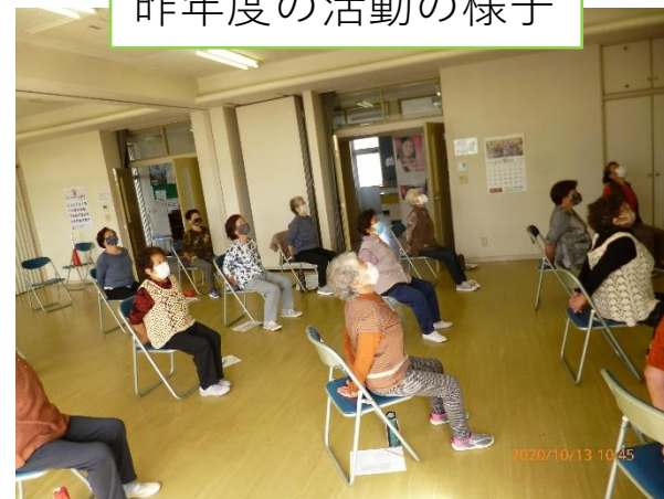
昨年度の活動の様子