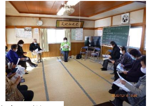
昨年度の講座の様子